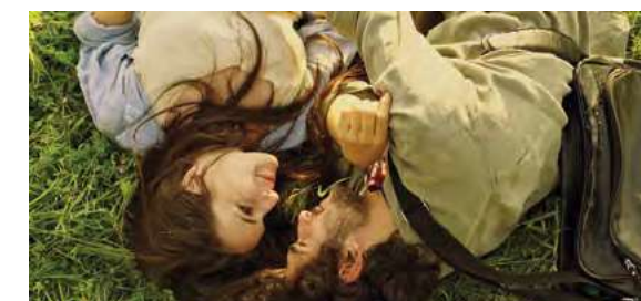
Work: Cristiana Gangale