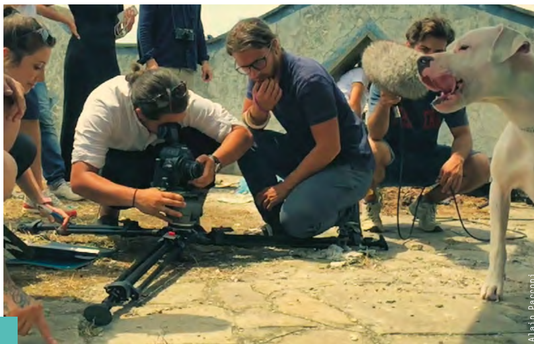
Work: Alain Parsoni

Studying Cinema through our Bachelor of Arts means all of this. It means studying in Rome, the city where a new and flourishing audiovisual industry has developed and is in constant transformation. But first of all it means possessing the necessary technical knowledge to work with motion pictures: learning basic filmmaking techniques, the art of directing and of directing actors, film shooting and editing techniques, lighting systems and sound technology, cinematography and to learn and live on set. But it also means learning creative writing skills, the mechanisms behind production and distribution and the different sectors of the visual industry, from cinema, to television, to the web. It means learning about the history of cinema and video, as well as about aesthetics intended as phenomenology of images. Nowadays those who want to work in the audiovisual industry must learn about the communication sector, know how to work in a team, how to organize and promote their work, also by making a pitch. They must be capable of speaking and writing in English. For this reason a variety of essential history and critical thinking subjects complete the education provided by our Bachelor of Arts, in addition to many events with film and contemporary art key players. Students will also be involved in internships, workshops, advanced training courses and talks.