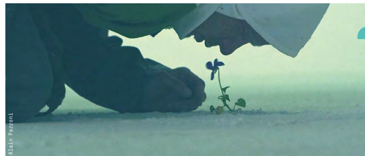
Work: Alain Parsoni

Cinema graduates will be capable of working in the many creative professional fields related to the cinema and TV series industry as: directors and editors, cinematographers, script-writers, sound technicians, production assistants. They will also be capable of creating content for the audiovisual and advertising industry, to work as an assistants and associates in festivals and museums and as event organizers.