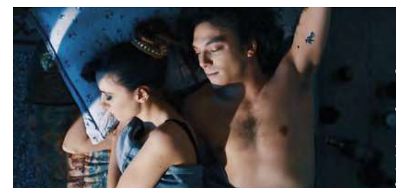
Work: Cristiana Gangale