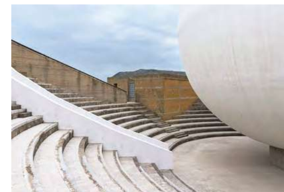
Work: Marta Ferrero

Il diplomato in Fotografia e audiovisivo potrà dedicarsi all'attività artistica, così come alle molte professioni creative legate al mondo della fotografia: potrà dedicarsi al fotogiornalismo, lavorare negli archivi fotografici, nell'industria dell'audiovisivo, come direttore della fotografia, nel mondo della comunicazione e della pubblicità, come social media manager, come assistente e collaboratore nei musei e nelle gallerie d'arte, come organizzatore di eventi.