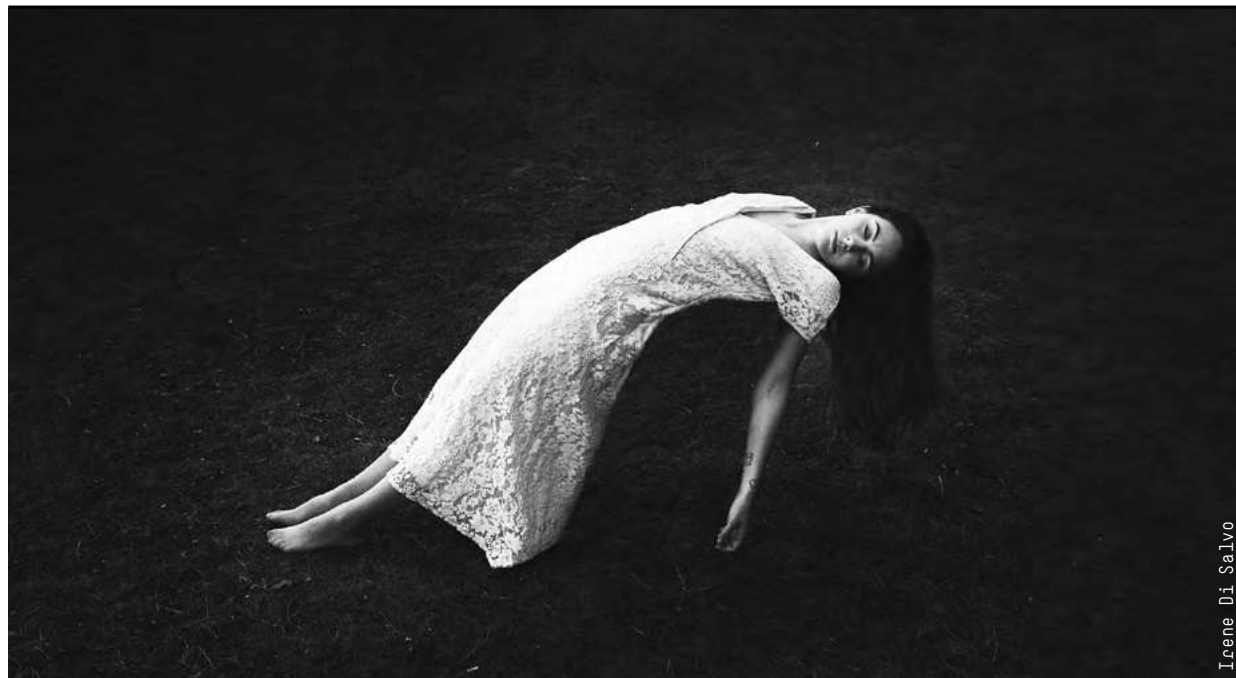
Work: Irene Di Salvo