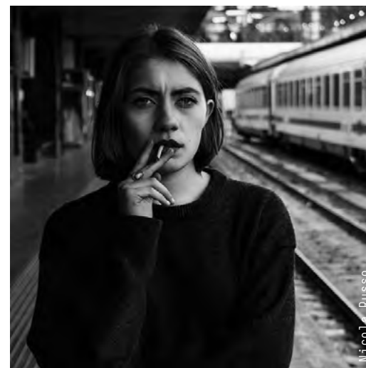
Work: Micol Russo

through the moment, be it the glamorous one of a magazine, the dramatic one of a newspaper, the conceptual one exhibited in a museum, or the intangible one that streams on a touch screen. Studying Photography and Audiovisual through our Bachelor of Arts means all of this. But first of all it means possessing the necessary technical knowledge to work with this medium: learning the basic photography techniques, but also editing and film shooting techniques, lighting systems and cinematography, as well as digital image processing.